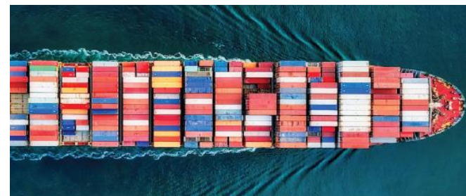
擴建 林查班國際港 (2025)