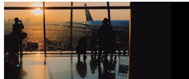
新建 烏達堡國際機場 (2024)