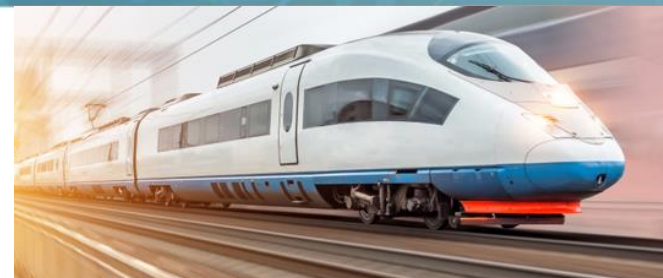
新建 高鐵達連接3機場 (2025)