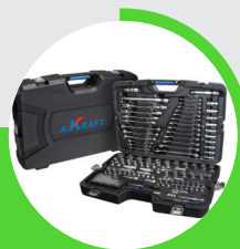
EXHIBIT CATEGORIES AND EXHIBITION AREAS 展品範疇與展區

以歐美市場為主、新市場為輔，包含美國，加拿大，巴西，澳洲，日本，韓國，中國，英國，德國，法國，埃及，南非，阿聯酋等國家為主，透過專業媒體及數位媒體交叉投放，另將精準邀請產業指標團體代表來台與會，精彩可期。